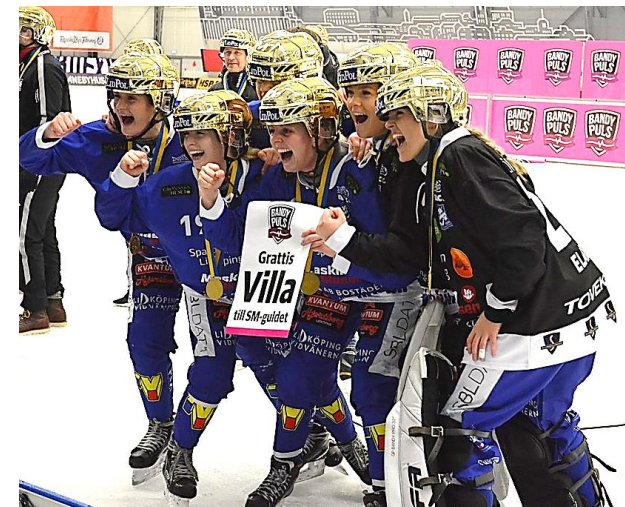
Bandylaget Villa Svenska mästare DAM 2021, 2022, 2023, 2024 HERR 2019, 2021, 2024