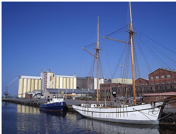
Hamnen, vid Vänern (Europas tredje största insjö)