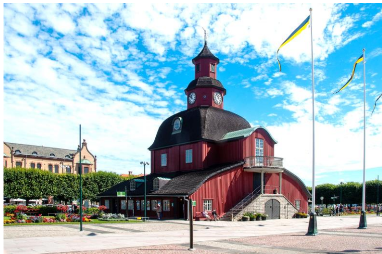
Gamla rådhuset (1672)